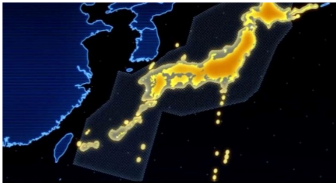
自衛隊の防空海域の範囲